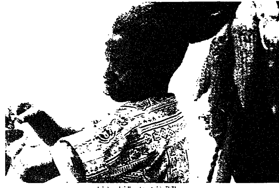
لقطة أخرى من «الخيار» ايضاً

بساطة، نحاول تقاسم افكارنا ومشاعرنا. وهذا الجمهور يمكنه المتابعة، هذا جيد.